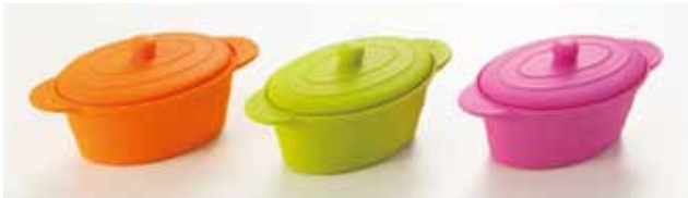
オーバルココット 3Pセット